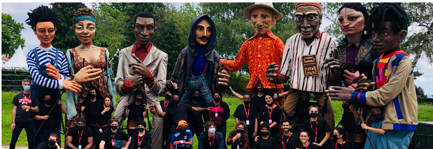
Marionnettes géantes à La Biennale de Lyon, Les grandes personnes

Votre cité accueille de surprenants voyageurs. Un petit groupe de géants va petit à petit découvrir ses quartiers, partir à la rencontre de ses habitants, et de ses monuments. On verra ces marionnettes géantes, mesurant jusqu'à quatre mètres de haut, demander leur chemin, rechercher un hôtel, écrire de très grandes cartes postales, prendre la population en photo et investir la ville.