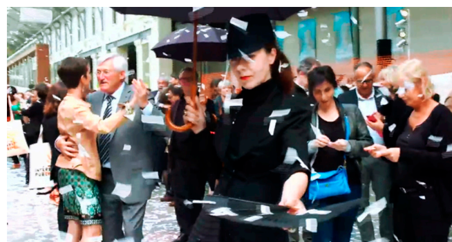
Tempête littéraire, Les souffleurs commandos poétiques

L'association qui se bouge pour des logements et des papiers pour tous et toutes. C'est par le travail collectif, et notamment un service de traiteur restauration et de cantines populaires, que l'association mutualise des fonds afin de payer des colocations solidaires. Ces activités sont une manière de sortir collectivement de la précarité, mais aussi de maintenir des liens forts, de partager largement nos convictions pour un monde plus juste et de promouvoir les traditions culinaires d'Afrique de l'Ouest.